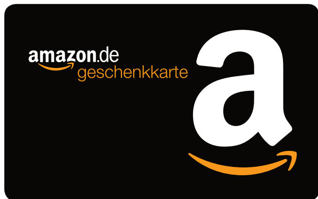
GENERISCHER GUTSCHEIN MIT VARIABLEN BETRAG