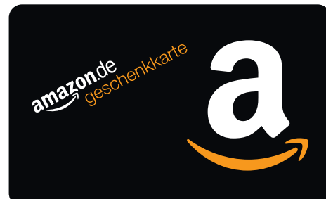
BITTE KEINE ELEMENTE UMORDNEN