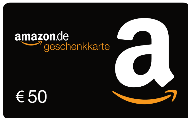
GENERISCHER GUTSCHEIN MIT ANGABE DES BETRAGES