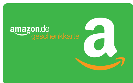
NICHT DIE HINTERGRUNDFARBE ÄNDERN