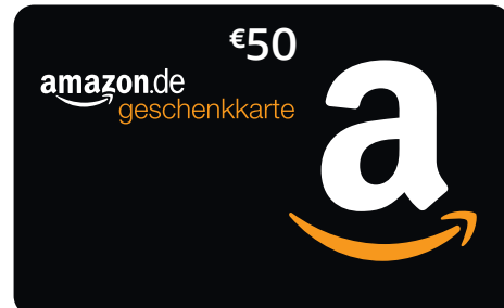
NICHT DEN BETRAG BEWEGEN