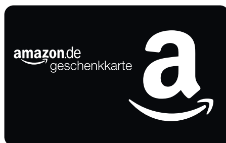
NICHT DIE LOGOFARBE ÄNDERN