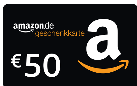
NICHT DIE GRÖSSE DES BETRAGES