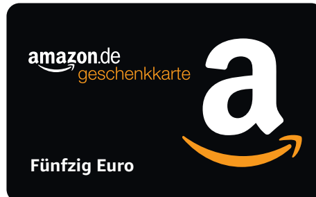
DEN BETRAG NICHT AUSSCHREIBEN