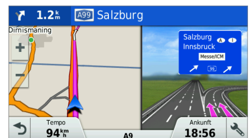
Fahrspurassistent & 3D-Kreuzungsansicht