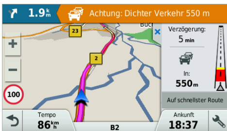
Live Traffic - Verkehrsinfos in Echtzeit