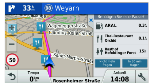
Sicherheitspaket - Hinweis auf Müdigkeit