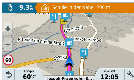
Sicherheitspaket - Hinweis vor Schulzone