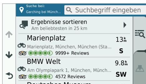
TripAdvisor® POIs mit Bewertungen