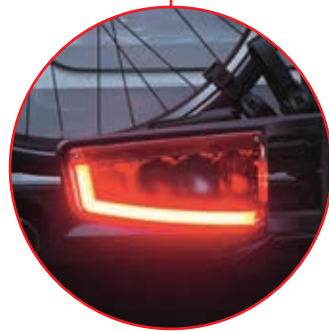
moderne LED-Leuchten (nicht bikelander classic)