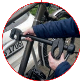
flexible, gummierte Halterungen