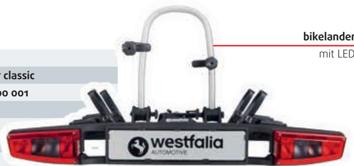
bikelander mit LED